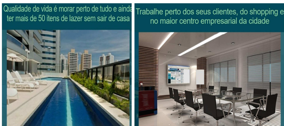
Figuras 1 e 2 - Imagens da campanha de marketing do empreendimento Salvador Prime