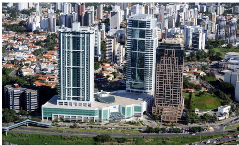
Figura 3 - Fotografia do Edifício Mundo Plaza em Salvador