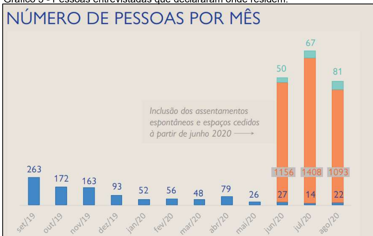
Gráfico 3 - Pessoas entrevistadas que declararam onde residem.

Ademais, o relatório demonstrou que entre setembro de 2019 e maio de 2020, 952 pessoas viviam nas 3 ruas, e que, a partir de junho de 2020 (momento em que foi incluído na pesquisa os assentamentos espontâneos e espaços cedidos), observou-se que até agosto do mesmo ano, cerca de 3.657 pessoas vivem em 4 assentamentos espontâneos, 63 pessoas vivem fora dos espaços cedidos e assentamentos, e 148 pessoas vivem em 5 espaços cedidos, como é demonstrado no gráfico abaixo (OIM, 2020).