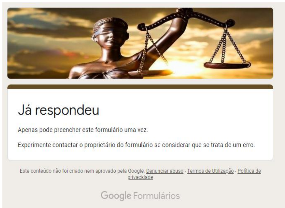
Figura 04 – Mensagem que aparecerá se o usuário tentar reabrir o link do questionário