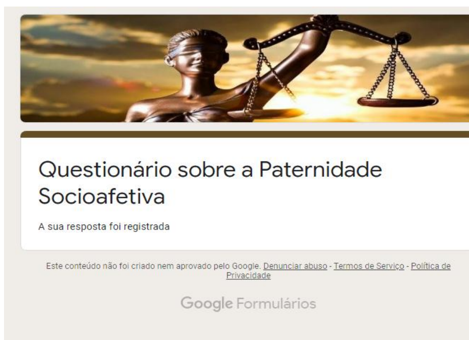
Figura 03 – Mensagem após responder o questionário