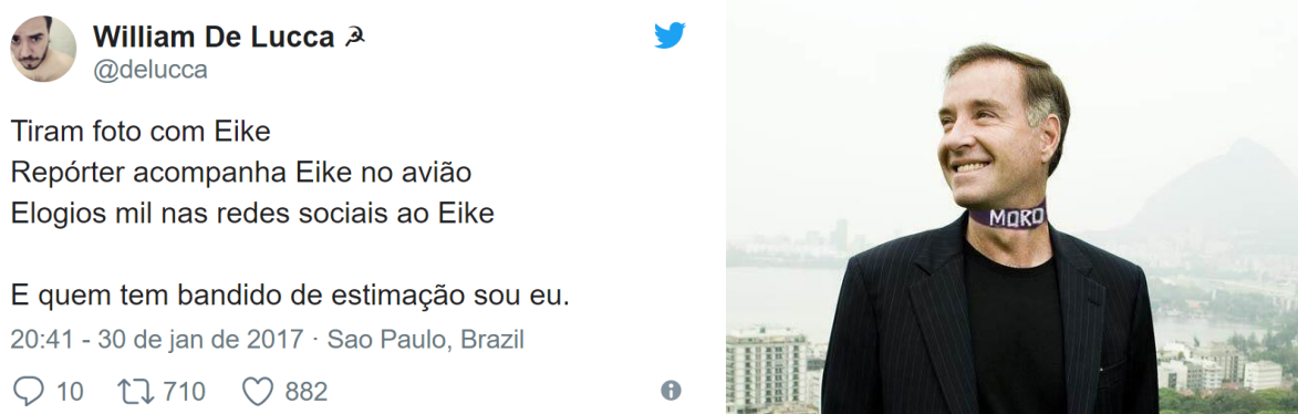
Figura 6 - Interdiscurso da polarização política

Em sequência, é importante ressaltarmos que a utilização dos memes relativos a prisão do Eike Batista traz à tona também o interdiscurso de uma disputa política mais ampla no cenário nacional, isto é, sobre a polarização da população em função de uma disputa partidária entre os considerados de direita e de esquerda, assim como ilustrado pela Figura 6, formada a partir de uma publicação no Twitter e de um meme vinculado em Vieira (2017).