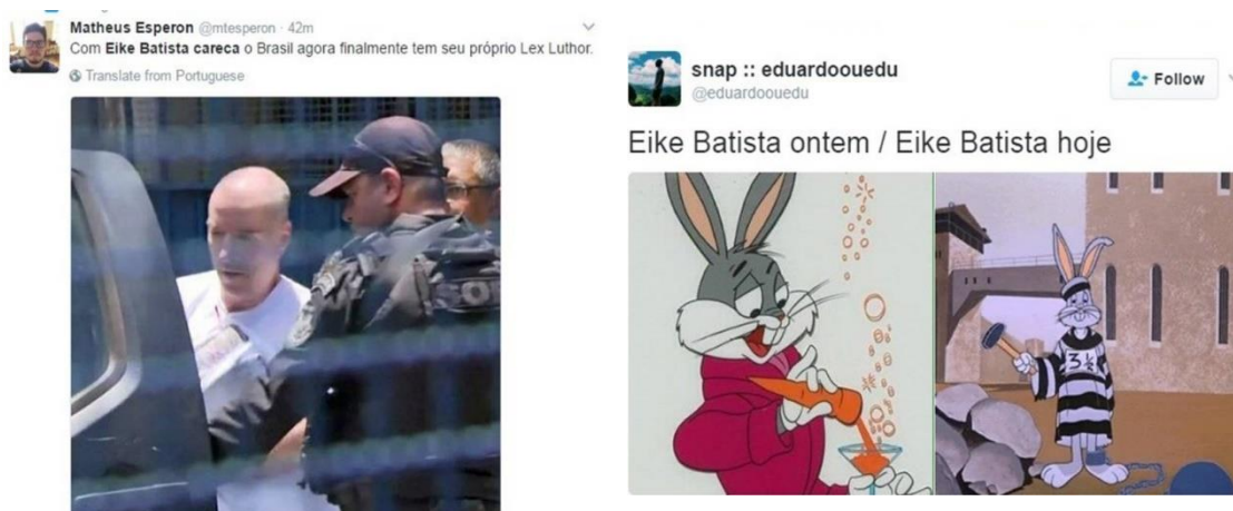
Figura 4 - A vilanização do herói

Outro percurso semântico identificado na análise dos memes diz respeito a desconstrução da imagem do “empreendedor popstar ” (FREIRE FILHO; CASTELLANO, 2012), iniciando um processo de vilanização da imagem do empresário, conforme demonstra a figura a seguir, elaborada a partir de memes vinculados em Vieira (2017).