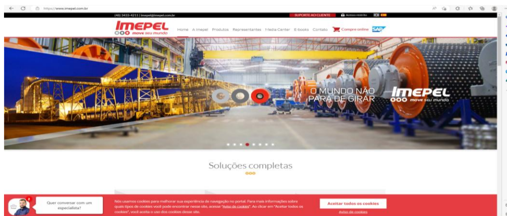
Figura 1 - Site Imepel

Para se atender ao disposto na LGPD, o site eletrônico deve conter a política de cookies e de privacidade, bem como o canal de comunicação do titular com o encarregado de dados da organização e os meios disponíveis para o exercício dos direitos do titular (ver Figura 1).