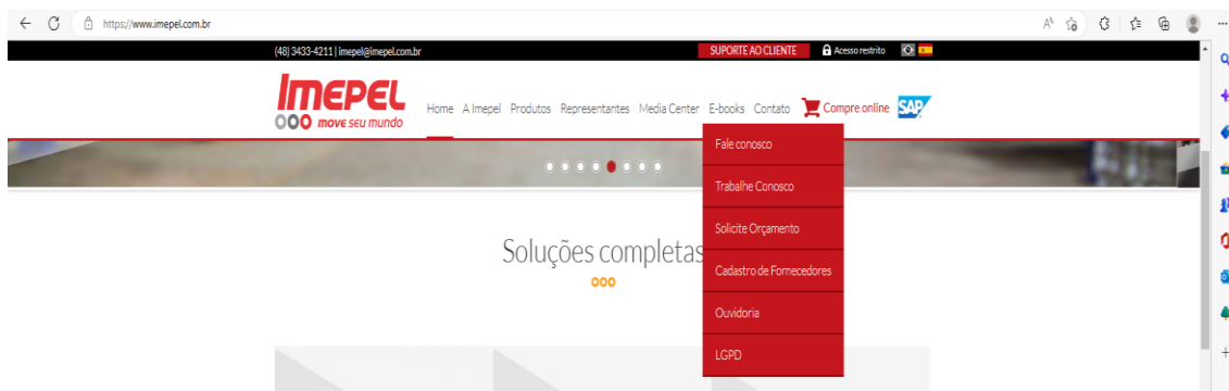
Figura 2 - Aba LGPD

Ainda, da análise do site eletrônico da empresa, observa-se que a “política de privacidade”, que é o documento exarado pela organização orientativo das ações relativas à privacidade dos titulares e de proteção dos dados pessoais, está apresentada em documento sintético, descrito como “aviso de privacidade”, acessível através da aba “fale conosco”. Existe um campo destinado à LGPD no site da organização, que é acessado pela aba “contato”, conforme ilustrado na Figura 2.