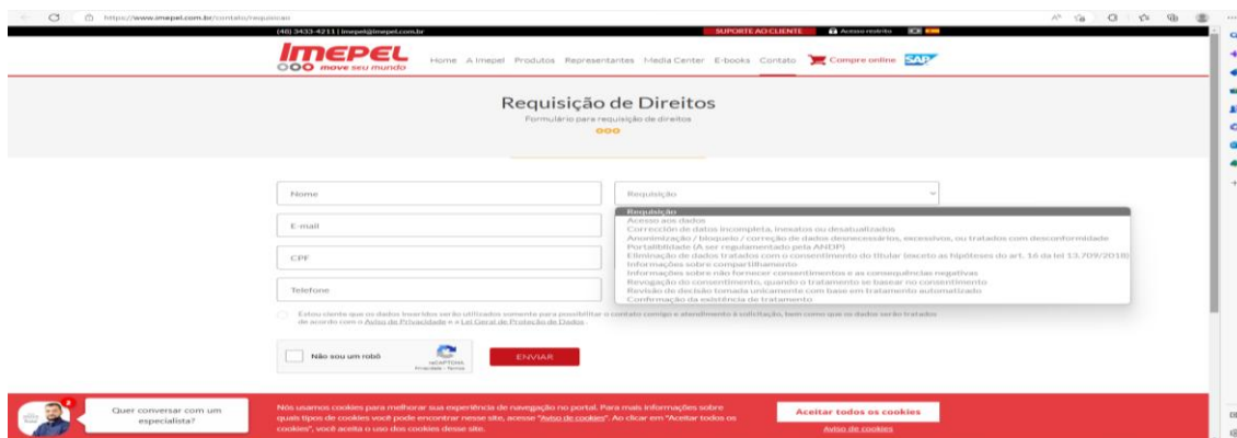
Figura 4 - Formulário Requisição de Direitos

A análise do site eletrônico da empresa indica que, embora atenda de forma geral à LGPD, é necessário incluir no site as opções para o usuário “gerir os cookies ” ou “rejeitar todos os cookies ”. Além disso, é importante disponibilizar um formulário específico para que o titular possa requisitar seus direitos e entrar em contato com o encarregado de dados em local de destaque e de fácil acesso. Só é possível acessá-lo através da aba “contato”, clicando na opção “LGPD” e buscando o formulário específico através da leitura do texto apresentado neste item, conforme Figura 4.