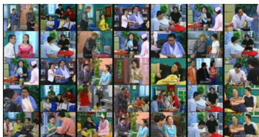
Figura 2 – Mosaico de Vídeo.

Quadros-chaves e mosaicos podem ser utilizados na criação de índices, através da extração de características de imagem, como cor, textura e forma. Por sua vez, as tomadas são adequadas para extração de características envolvendo movimento.