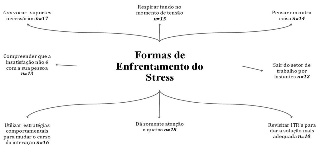
Figura 3 - Formas de enfrentamento do Stress

Definidas as situações mobilizadoras, foi solicitado aos participantes que relatassem quais estratégias eles utilizavam para poder lidar com o stress. A partir disso a figura a seguir foi construída a partir do compilado das principais estratégias utilizadas para enfrentar as consequências do stress.