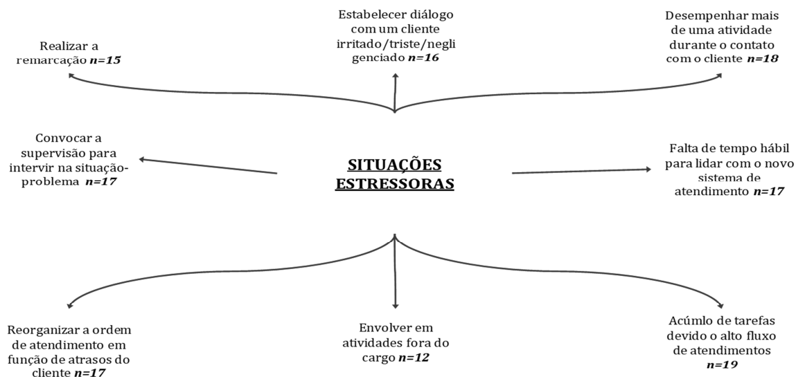
Figura 2 - Situações estressoras