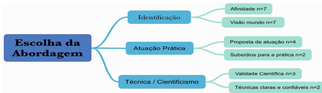
Figura 2 – Mapa mental acerca das subcategorias para a escolha da abordagem teórica

Fonte: Elaboração própria com base na entrevista estruturada